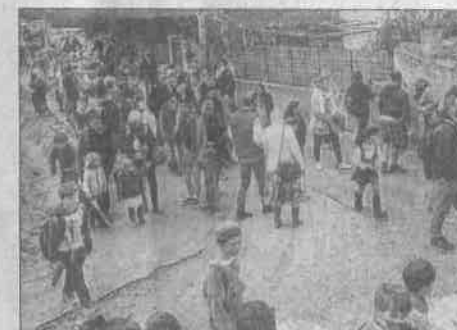
Une belle fête populaire.