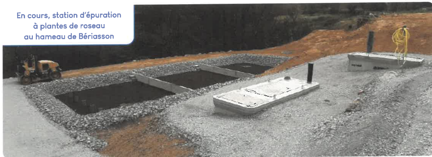
En cours, station d'épuration à plantes de roseau au hameau de Bériasson

Subventions attendues de l'Agence de l'eau et de l'Etat