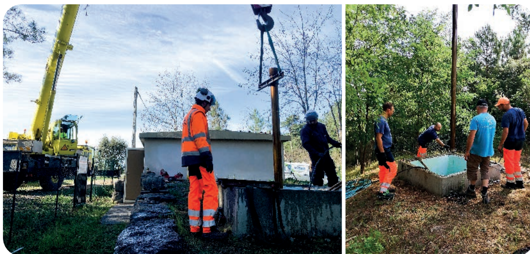
Forage de la Pazuzette, remplacement de la pompe

Achat de terrain pour le périmètre de sécurité au captage de la source de TUREL.